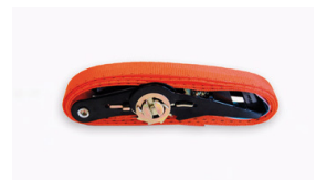
Zurrgerät (2 Stk)