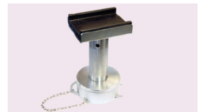
Aufsatzgarnitur mit U-Profil 150-233 mm