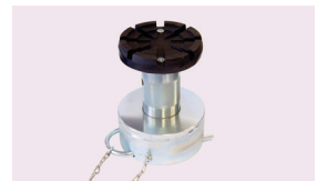
Verstellbare Aufsatzgarnitur 155-245 mm