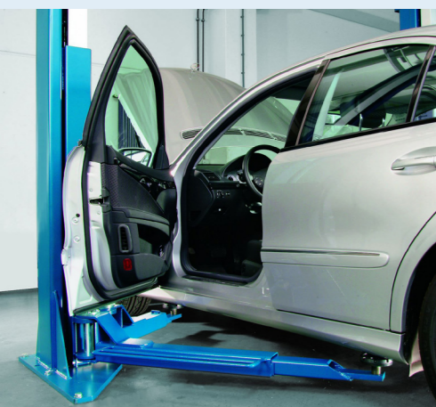
Türen können weit geöffnet werden