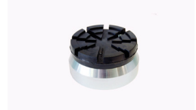
Aufsatzgarnitur 44 mm