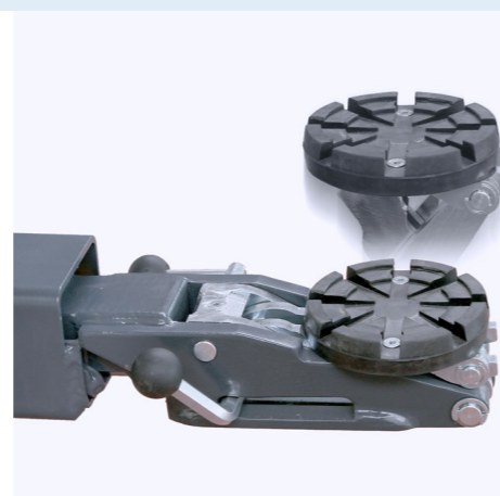
Mini Max Tragarme : Ideal für das Anheben von Geländewagen und tiefliegenden Fahrzeugen