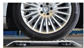
Auffahrplatten (4 Stk)